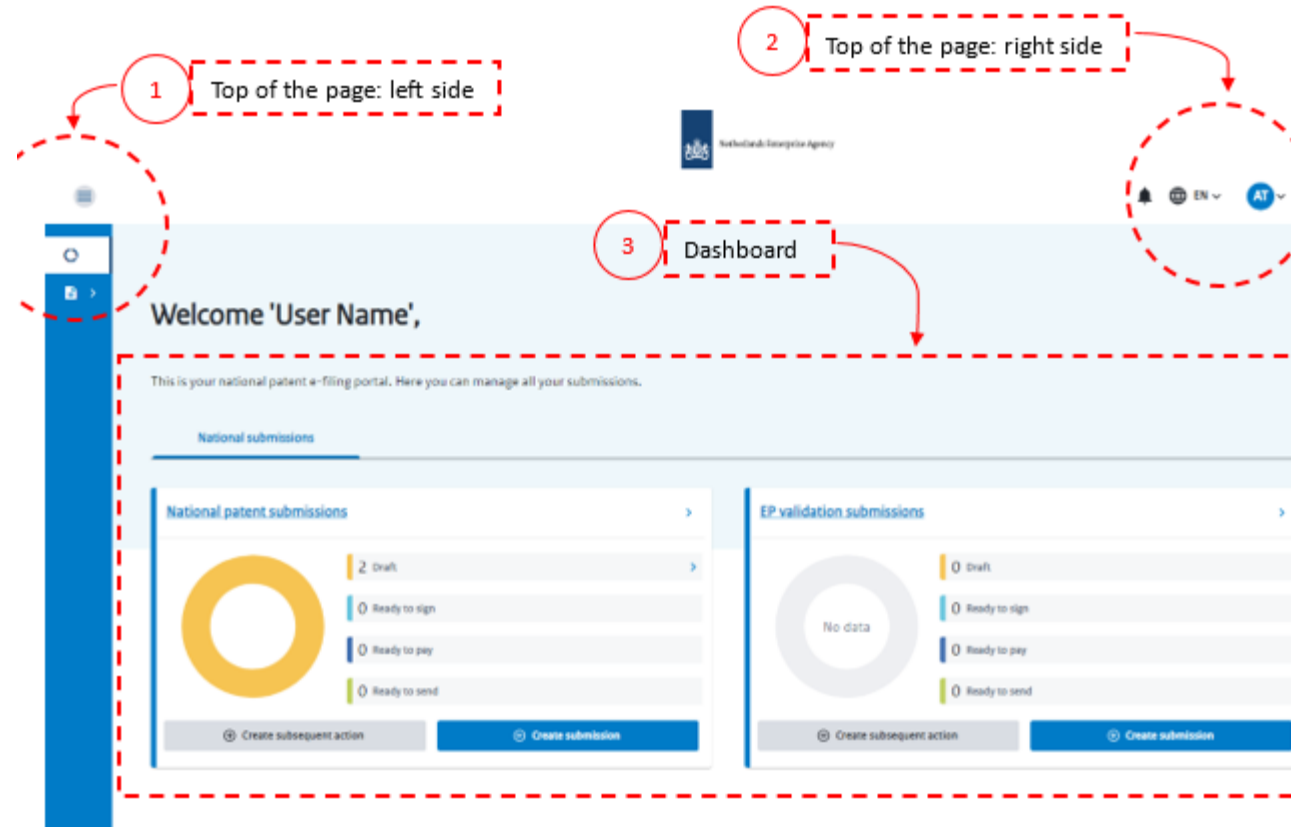
Figure 3 - Three main sections of the Front Office dashboard page.

To better explain all the functionalities of the Front Office dashboard, let's divide the page in three sections: 1) Top of the page: left side, 2) Top of the page: right side and 3) Dashboard, as you can see in Figure 3.